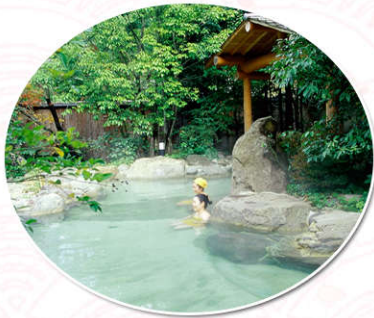
安排1晚温泉酒店 体验正宗泡汤之乐