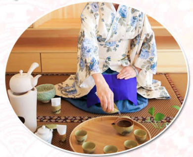
特赠送日式正宗茶道体验