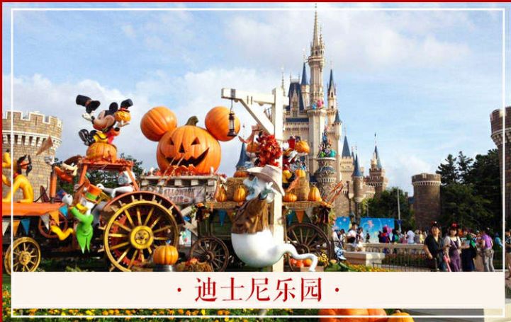
・ 迪士尼乐园 ・