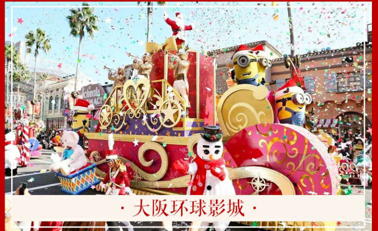
・ 大阪环球影城 ・