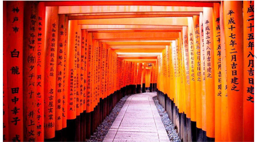
Fushimi Inari Shrine

伏见稻荷大社建于8世纪，主要是祀奉以宇迦之御魂大神为首的诸位稻荷神。它是京都地区香火最盛的神社之一。