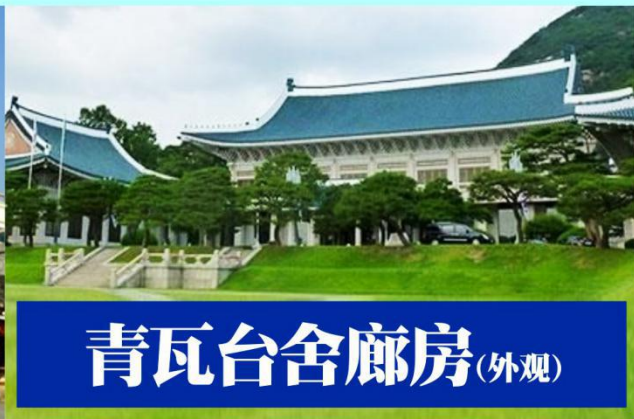
青瓦台舍廊房(外观)

位于景福宫内的国立民俗博物馆是展示韩国的传统生活方式的地方，是韩国唯一全面展示民俗生活历史的博物馆。