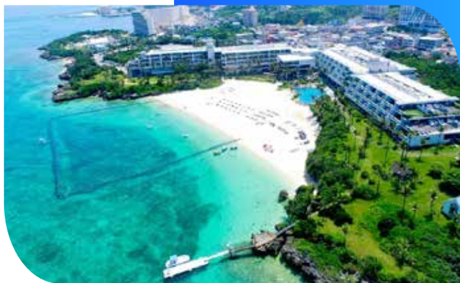
冲绳月亮滩酒店 Hotel Moon Beach