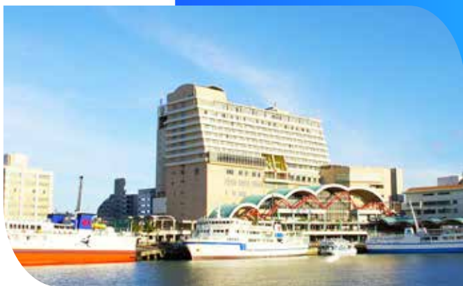
冲绳喜璃愈志酒店

从酒店到冲绳那霸机场坐出租车只需要15分钟，均很便捷。旅客们可以发现糸满中央市场 到酒店只有很短的距离。酒店占尽地理之宜，丰崎沙滩、琉球玻璃村和濑长岛离此都很近。