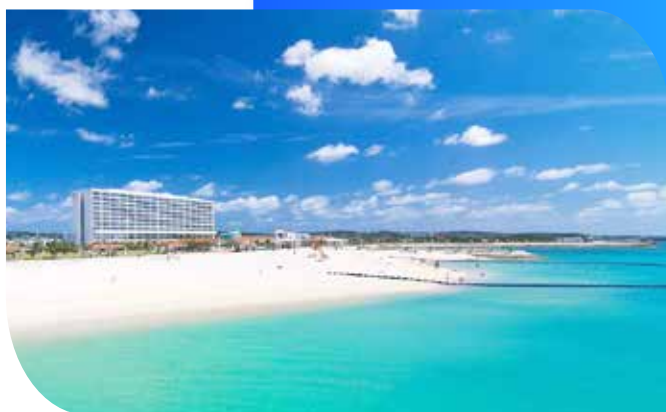
冲绳南方海滩酒店

客人可在私家海滩上休憩、打网球或享受按摩松弛身心。酒店还设有室外游泳池和健身中心，并提供多种海上活动设施。客房设有阳台，公共区还提供免费无线网络连接。