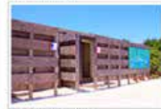
◆ 更衣室, 淋浴室