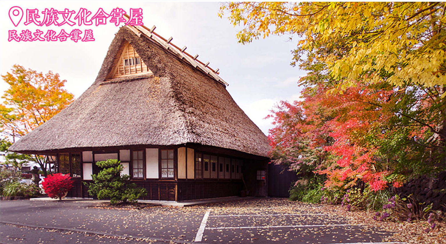
📍民族文化合掌屋 民族文化合掌屋

合掌屋，世界著名文化遗产“白川乡合掌屋”。位于日本岐阜县白川乡荻町。这里四面环山、水田纵横、如诗如画。目前人口大概有1900人左右。合掌建筑屋是不用任何钢筋水泥建成的高达四五层的楼房，共有114栋，其中民宿和民家有59栋。