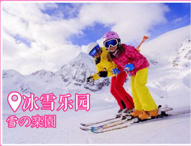
📍冰雪乐园 雪の樂園

富士急，富士急HighLand（富士急ハイランド、ふじきゅうハイランド），又被称为Fujikyū Highland, Fuji-Q Highland, Fuji-Q。它是位于山梨县富士吉田市新西原5丁目和富士河口湖町的游乐场（以下简称富士急）。富士急拥有以“高飞车”“FUJIYAMA”“ドドンパ”“ええじゃないか”（由于后两项均为名称不好翻译，以下均以罗马字简写为“DODONPA”和“EEJANAIKA”）为首的绝对尖叫系列项目，可以说是刺激中的绝对刺激。