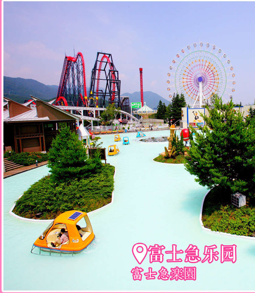
📍富士急乐园 富士急樂園

冰雪乐园，富士山是个活火山，到目前为止，还时不时的涌动一下满满的热量，富士山开发了一个雪乐园，在这里可以疯玩，与厚厚的洁白的雪，来一场亲密的约会。在这里，大人小孩都是可以玩疯的，关键是从上海来的我们，感觉这里那么大的雪，却一点也不冷，上海没有雪的冬天，远远比这里寒冷刺骨多了