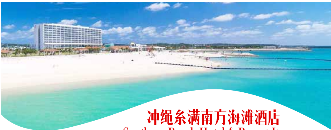
冲绳糸满南方海滩酒店 Southern Beach Hotel & Resort Itoman

从酒店到冲绳那霸机场坐出租车只需要15分钟，均很便捷。旅客们可以发现糸满中央市场 到酒店只有很短的距离。酒店占尽地理之宜，丰崎沙滩、琉球玻璃村和濑长岛离此都很近。