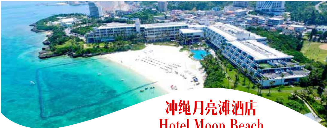
冲绳月亮滩酒店 Hotel Moon Beach

客人可在私家海滩上休憩、打网球或享受按摩松弛身心。酒店还设有室外游泳池和健身中心，并提供多种海上活动设施。客房设有阳台，公共区还提供免费无线网络连接。