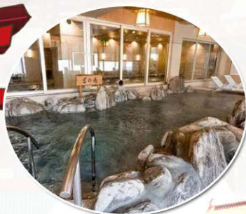
体验正宗泡汤体验