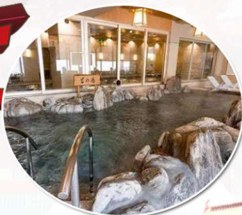
体验正宗泡汤体验