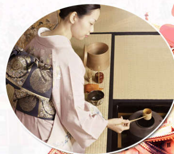
特赠送日式正宗茶道体验