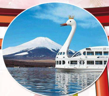
山中湖白鸟号游船

富士山芝樱公园：河口湖芝樱乐园是4-5月份首都圈最大级富士山绝境配上红白浓淡的分红芝樱隆重盛开！灿烂热情绽放的芝樱完全打破日本传统樱花娇嫩柔媚，将成为富士山最壮观花海美景，尽在眼前！