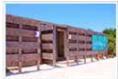
◆ 更衣室, 淋浴室