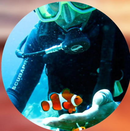
寻找《海底总动员》尼莫家族