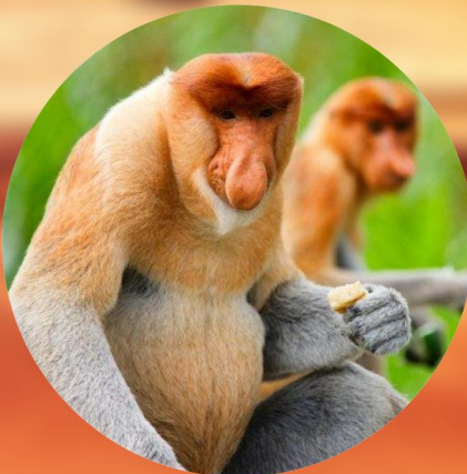
窥探丛林里长鼻猴