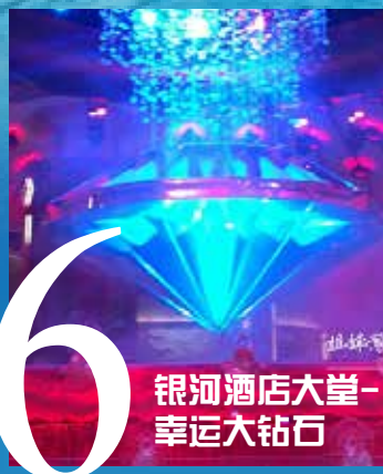
银河酒店大堂-幸运大钻石