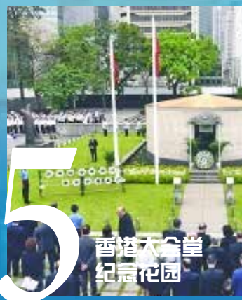
香港大会堂纪念花园