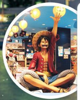
东京塔海贼王主题乐园