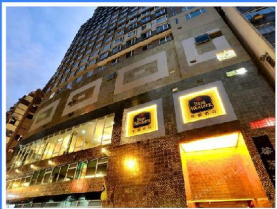
香港华丽都会酒店

座落于港岛西区，位置便利，临近香港大学，步行少于一分钟可抵达港铁西港岛线西营盘站(B1 出口)、步行少于三分钟至海味街购物及苏豪区品尝各国传统美食。