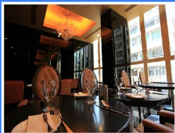
香港华丽海景酒店

座落于港岛西区，位置便利，临近香港大学，步行少于一分钟可抵达港铁西港岛线西营盘站(B1 出口)、步行少于三分钟至海味街购物及苏豪区品尝各国传统美食。