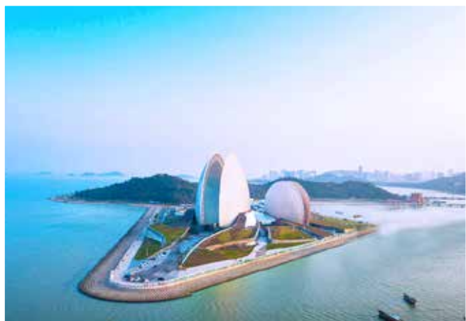
‘日月贝’歌剧院 Zhuhai Opera House