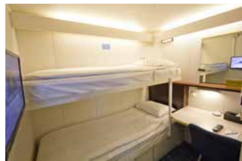
丽星邮轮-双鱼星号