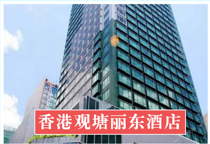
香港观塘丽东酒店