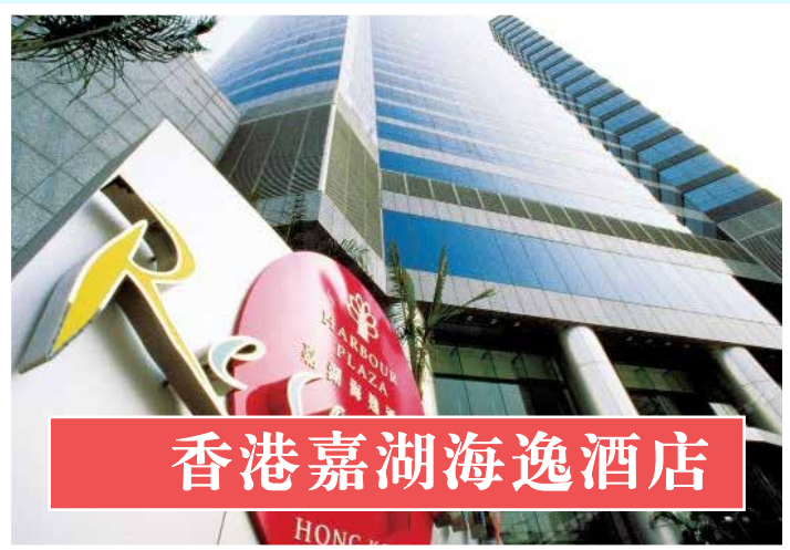
香港嘉湖海逸酒店