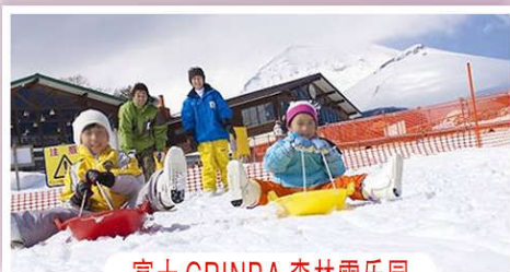
富士 GRINPA 森林雪乐园