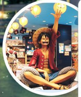
东京塔海贼王主题乐园