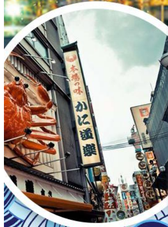
心斋桥·道顿堀美食街