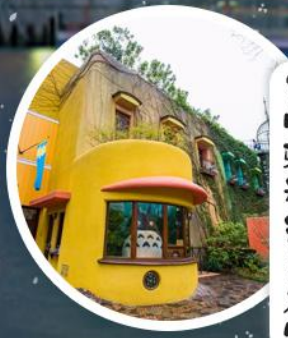
宫崎骏动漫美术馆