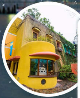
宫崎骏动漫美术馆