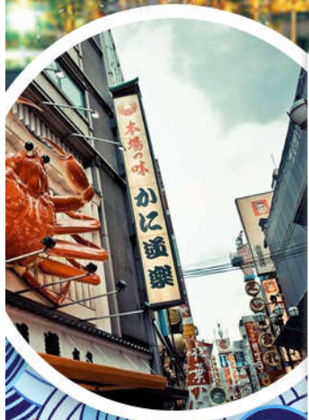
心斋桥·道顿堀美食街