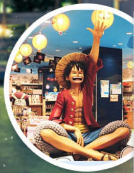
东京塔海贼王主题乐园