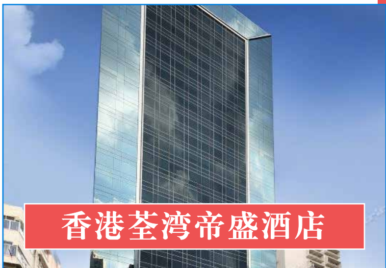
香港荃湾帝盛酒店