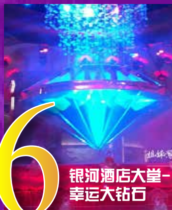
银河酒店大堂- 幸运大钻石