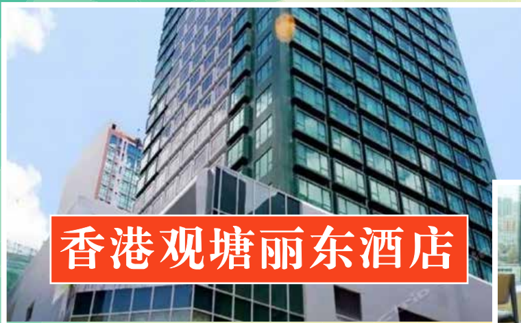
香港观塘丽东酒店

香港参考酒店（不指定酒店）：香港富荟马头围、香港荃湾帝盛酒店、香港观塘丽东酒店、香港嘉湖海逸酒店。