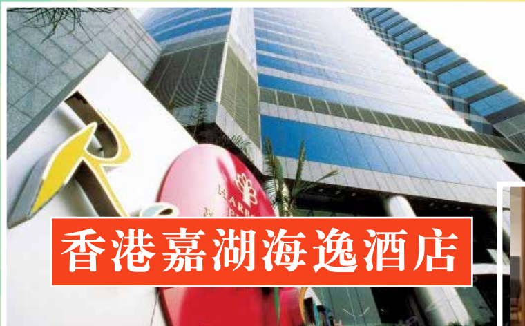
香港嘉湖海逸酒店