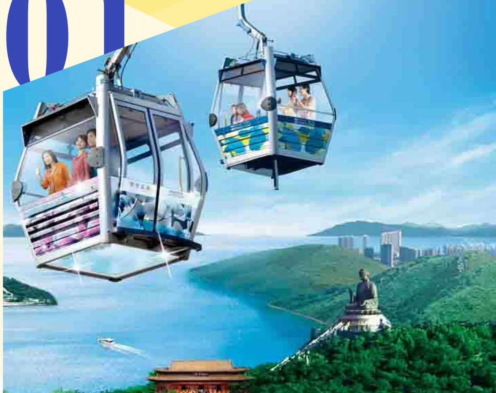
大屿山+昂坪360+昂坪市集+大奥渔村