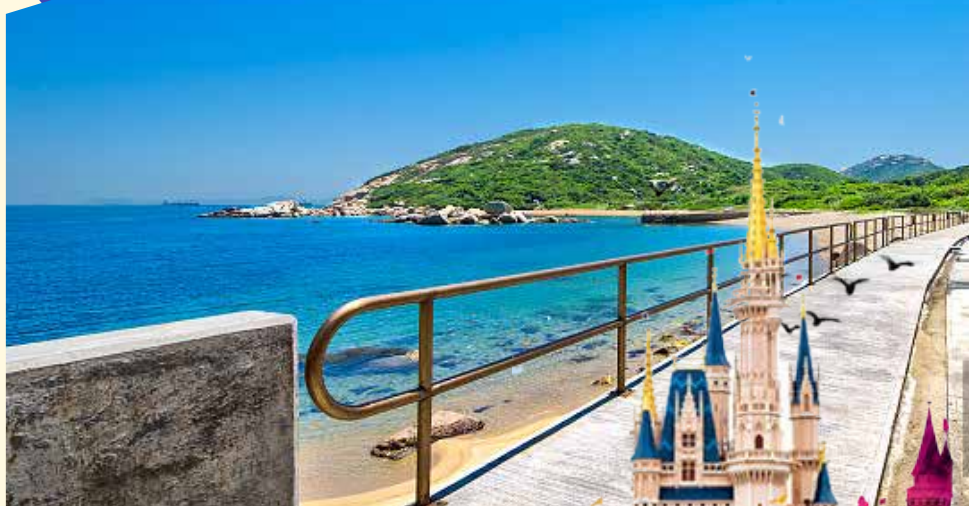
南丫岛+迪士尼乐园

早餐：营养早餐（牛奶+面包） 午餐：港式围餐（50HKD） 晚餐：园区餐厅（自理） 住宿：香港四星级酒店