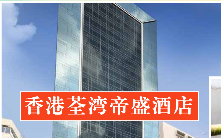
香港荃湾帝盛酒店