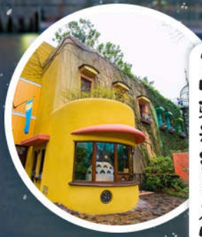
宫崎骏动漫美术馆