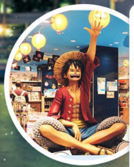
东京塔海贼王主题乐园