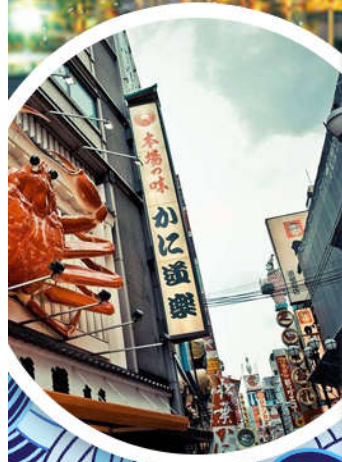
心斋桥·道顿堀美食街