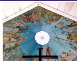
麦哲伦十字架：宿务岛殖民史开端的麦哲伦十字架，为当地人所信仰膜拜。