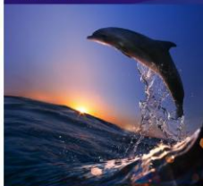
偶遇童话精灵—眼鳧猴