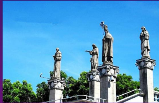
古老的圣像【幼年耶稣基督像】