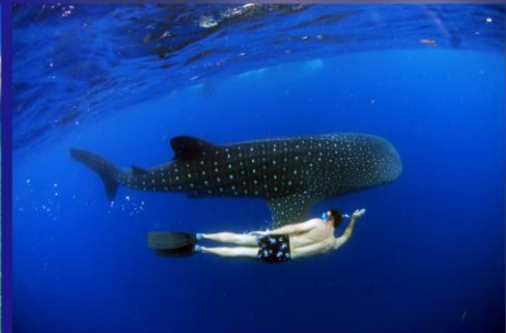
Oslob观鲸鲨 与鲸鲨共舞出海一日游