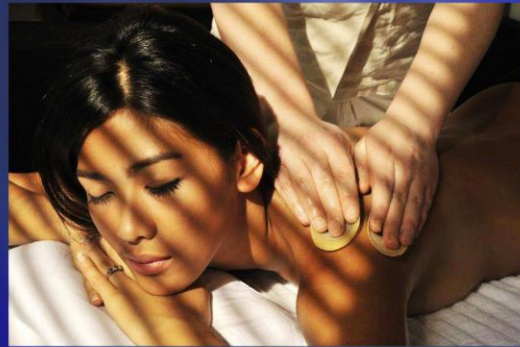
您可享受【菲式按摩】