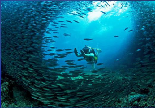
墨宝出海沙丁鱼风暴