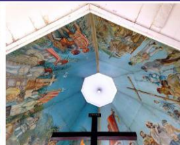
麦哲伦十字架：宿务岛殖民史开端的麦哲伦十字架，为当地人所信仰膜拜。