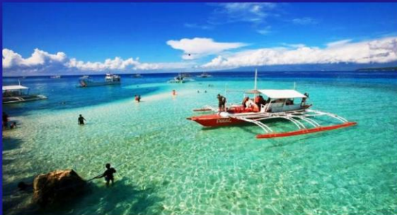
海鲜烧烤BBQ午餐 (资生堂岛)