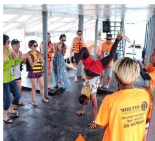
与船员表演跳舞互动