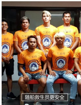
随船救生员更安全