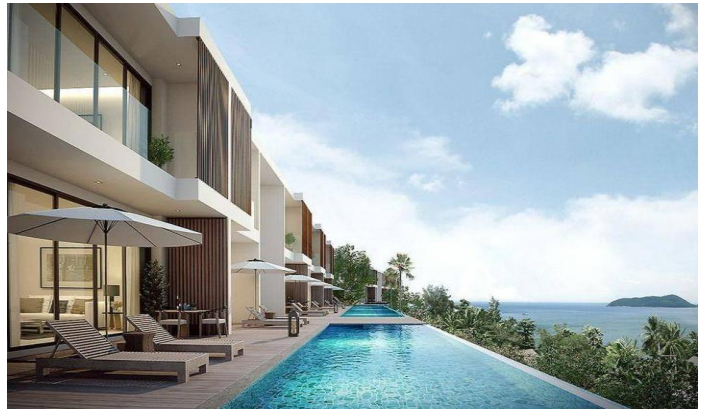
芭东湾山 Spa 及度假村套房