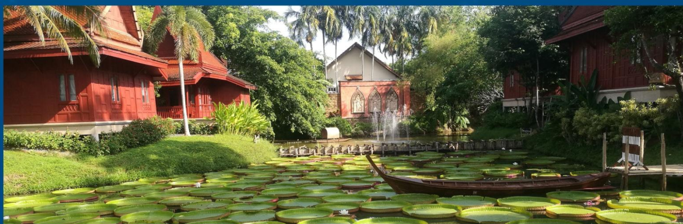
安潘达普吉酒店 At Panta Phuket