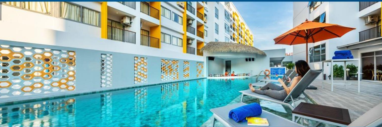
普吉蜂巢精品度假酒店 Beehive Boutique Hotel Phuket