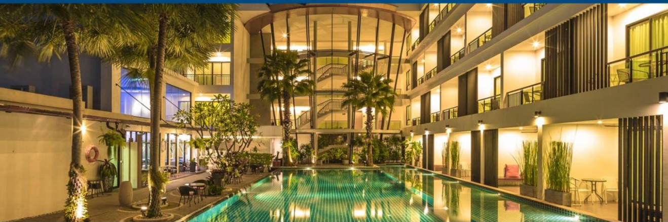
普吉岛帕果设计酒店 The PAGO Hotel