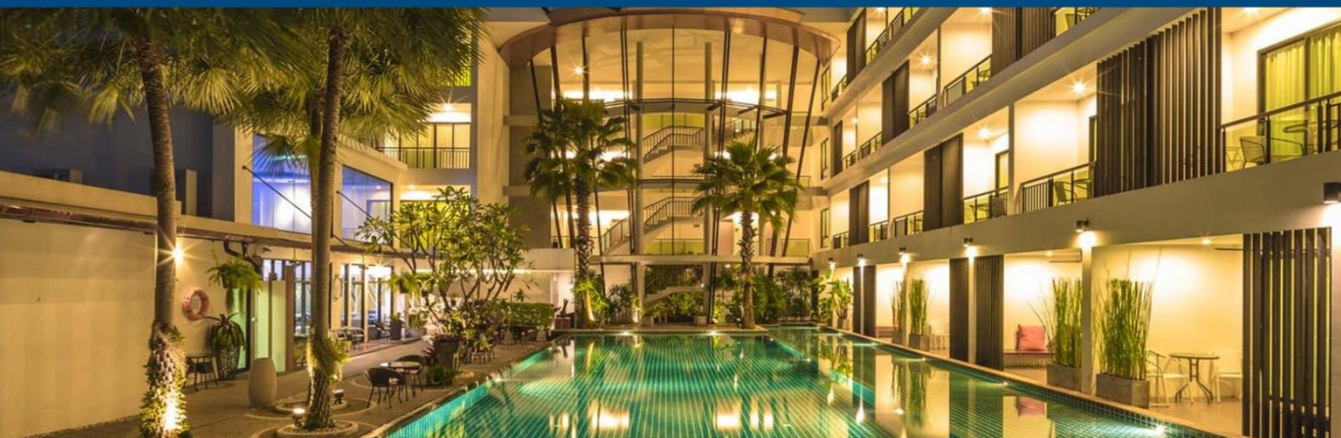
普吉岛帕果设计酒店 The PAGO Hotel