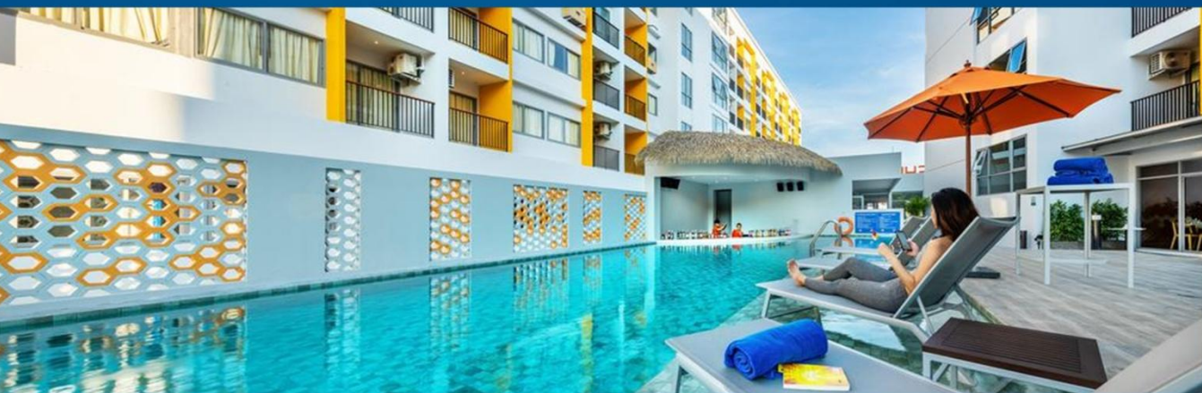
普吉蜂巢精品度假酒店 Beehive Boutique Hotel Phuket