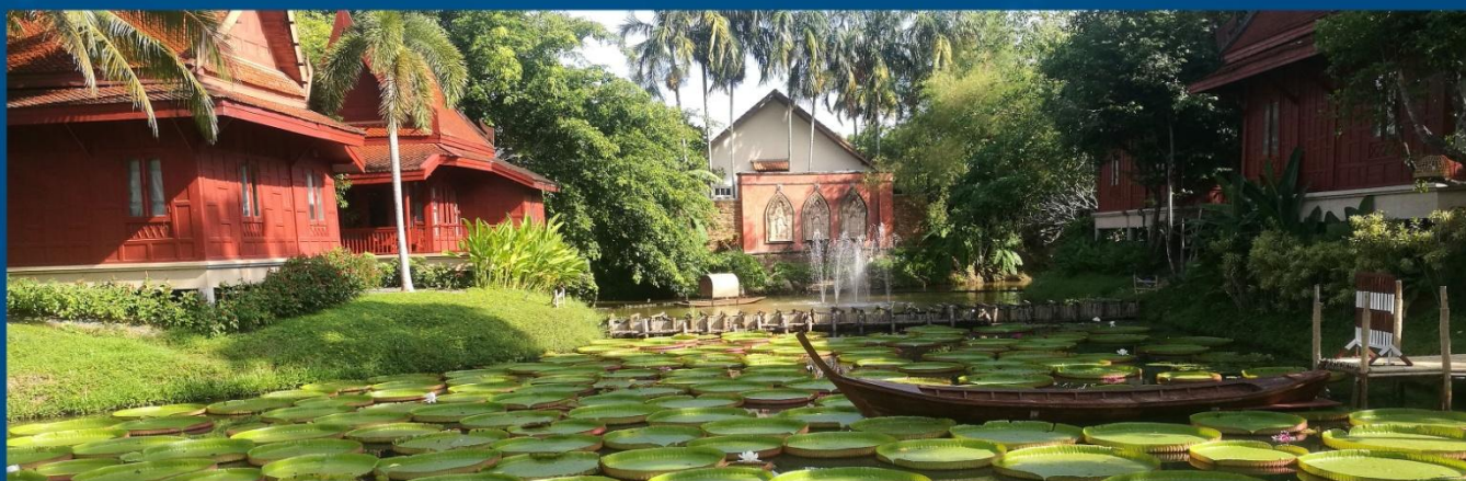
安潘达普吉酒店 At Panta Phuket