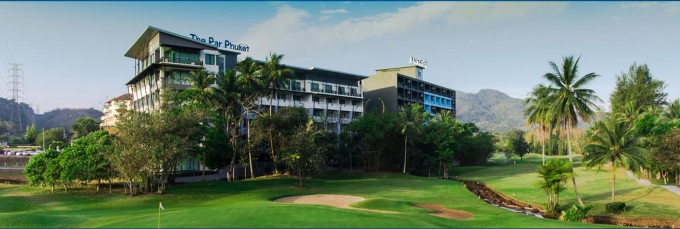
帕普吉岛酒店 The Par Phuket Hotel