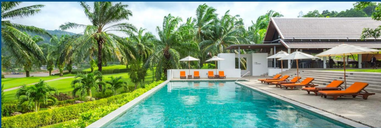
提尼迪高尔夫度假村 Tinidee Golf Phuket Hotel