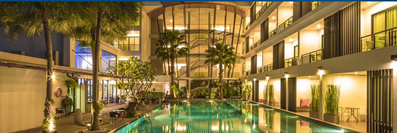
普吉岛帕果设计酒店 The Pago Hotel