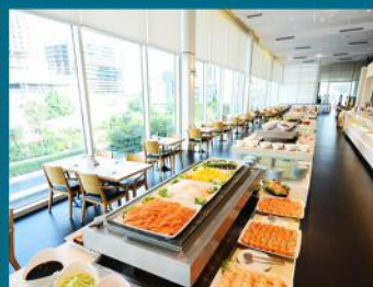
皇权国际海鲜自助餐