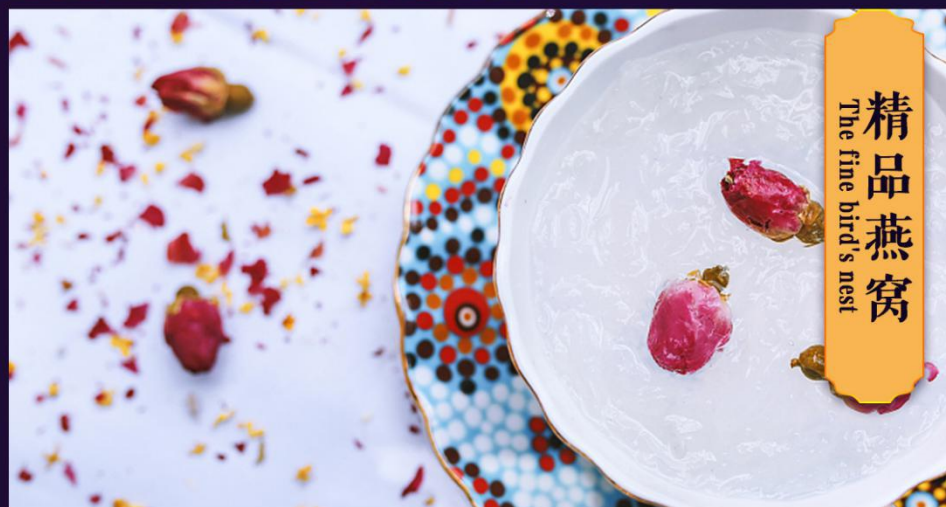
精品燕窝 The fine bird's nest