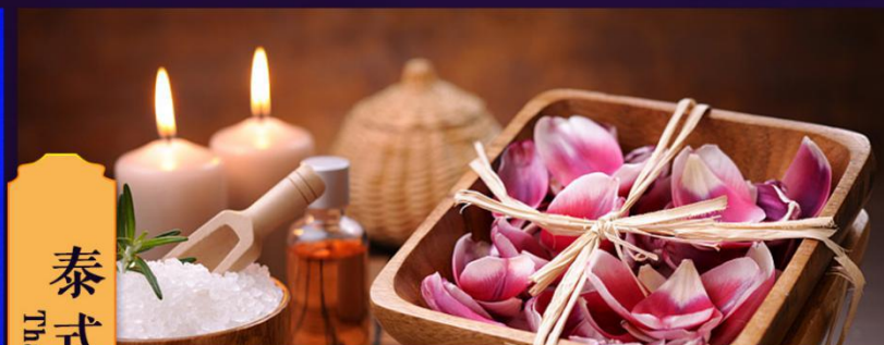
泰式SPA Thai SPA