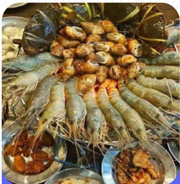
大头虾海鲜 BBQ 任吃