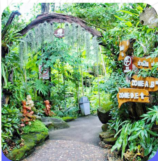
绿光森林米其林餐厅