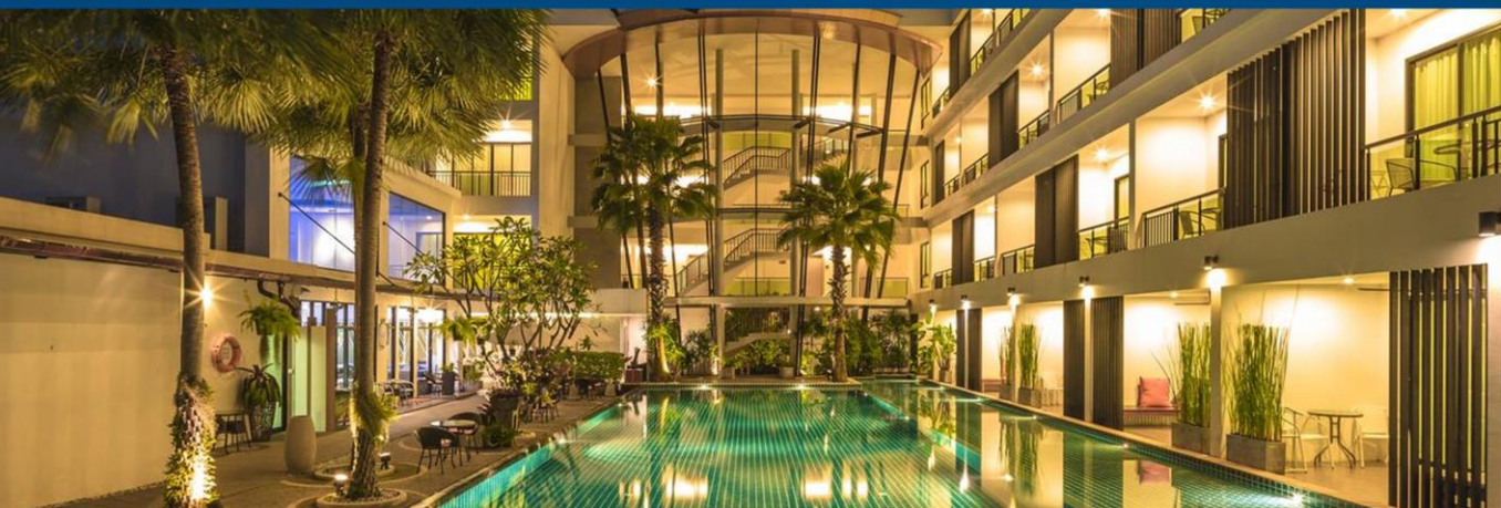
普吉岛帕果设计酒店 The Pago Hotel