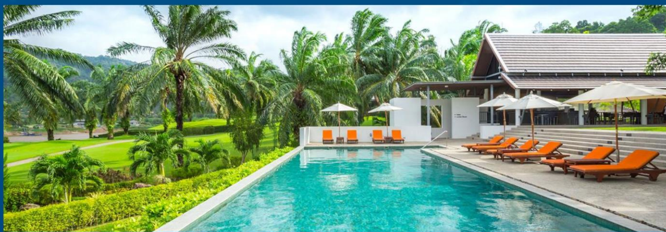
提尼迪高尔夫度假村 Tinidee Golf Phuket Hotel