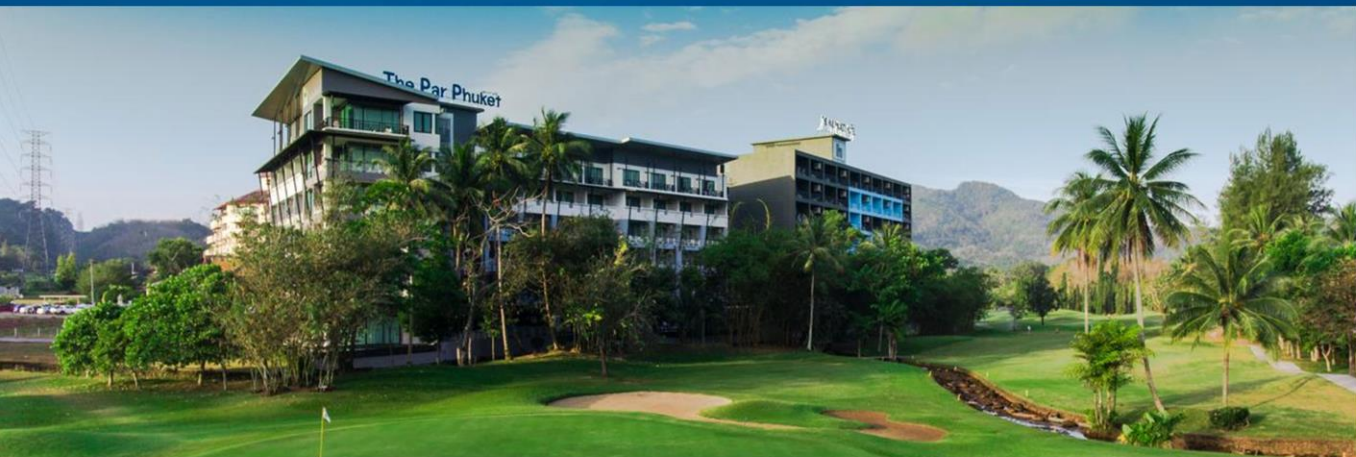
帕普吉岛酒店 The Par Phuket Hotel