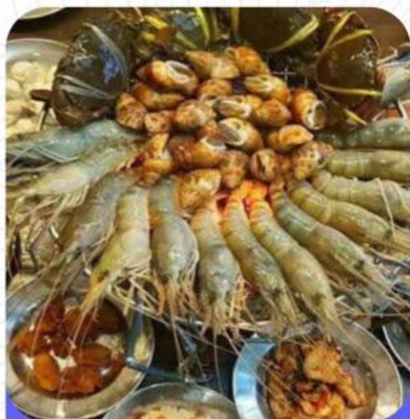
大头虾海鲜 BBQ 任吃