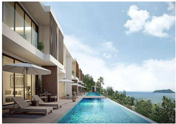
芭东湾山 Spa 及度假村套房