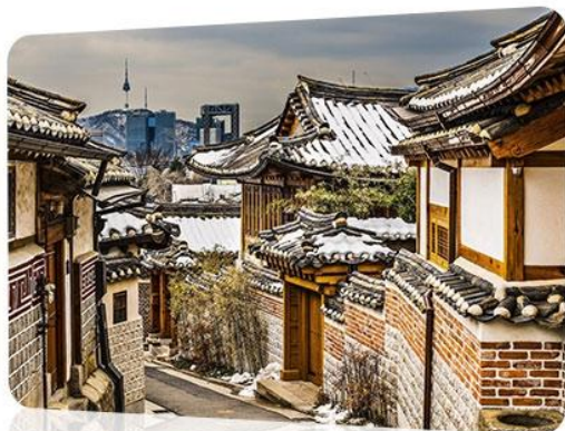
北村韩屋村 북촌한옥마을 景福宫 경복궁