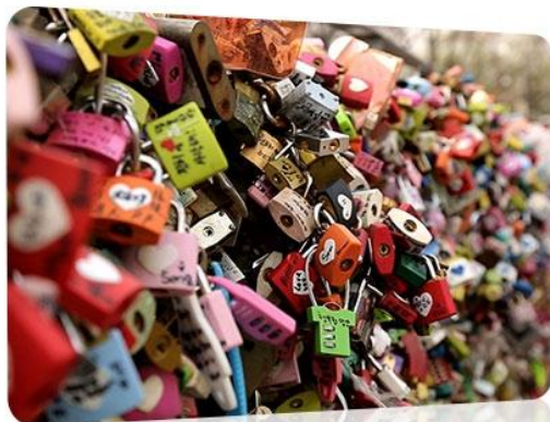
N 首尔塔 N 서울타워

北村韩屋村： 北村位于景福宫、昌德宫、宗庙之间,是传统韩屋密集的地方,也是首尔最具代表性的传统居住地,且到处都有很多史迹、文化遗产和民俗资料。因此,被称为城市中心的街道博物馆。北村的韩屋特点可概括为两点,即“进化的旧法”和“装饰化倾向”。虽然与传统韩屋相比,未具备完整的品格;如较低的屋顶斜度、圆梁、双屋檐、狭窄而多的房间数等,但是北村韩屋凝聚着韩屋的结构性和优美。从当时韩屋广告可以看到,它反映密度和匿名性等城市住宅的要求,且北村的韩屋作为新兴城市住宅类型,持续发展至今。