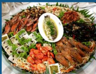
大富豪海鲜大拼盘 或日式自助料理