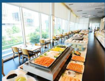
皇权国际海鲜自助餐