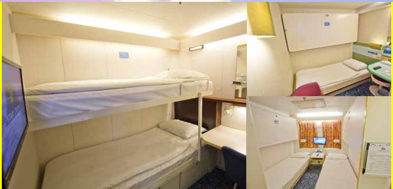
丽星邮轮-双鱼星号