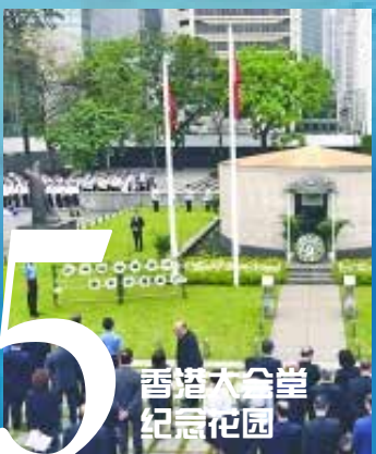
香港大会堂 纪念花园