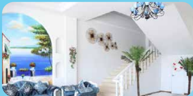
珠海爱情海酒店（平湖店）