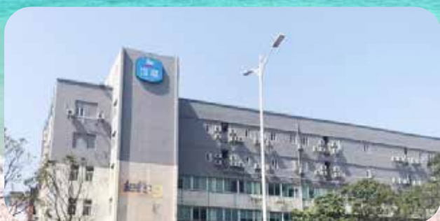
珠海汉庭酒店（吉大店）