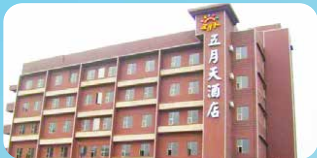
珠海五月天精品酒店