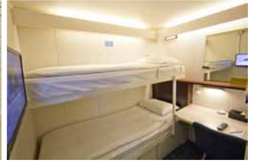
丽星邮轮-双鱼星号