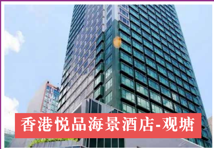
香港悦品海景酒店-观塘