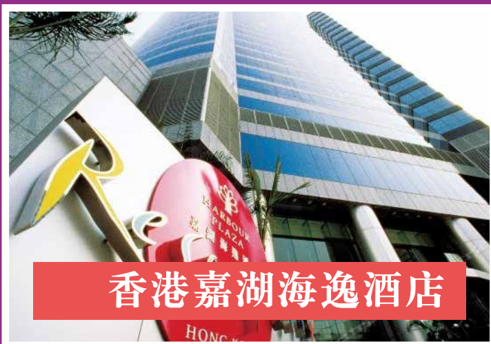
香港嘉湖海逸酒店