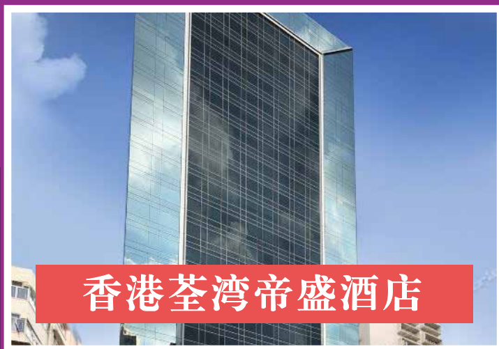
香港荃湾帝盛酒店