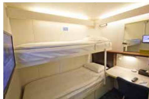
丽星邮轮-双鱼星号