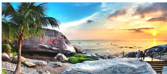
大小洞天5A-道家文化旅游圣地