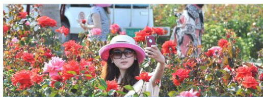
玫瑰谷3A-田野花海，诗情画意