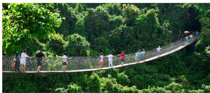
热带天堂森林公园4A-穿梭热带雨林，登高揽山海美景