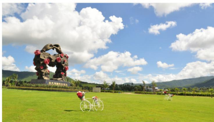
亚龙湾热带天堂森林公园4A 穿越雨林去看海