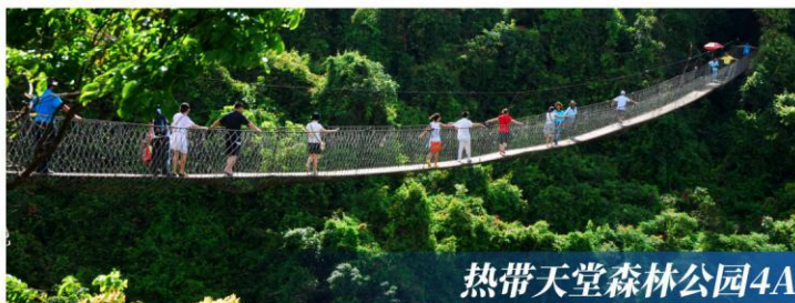
热带天堂森林公园4A