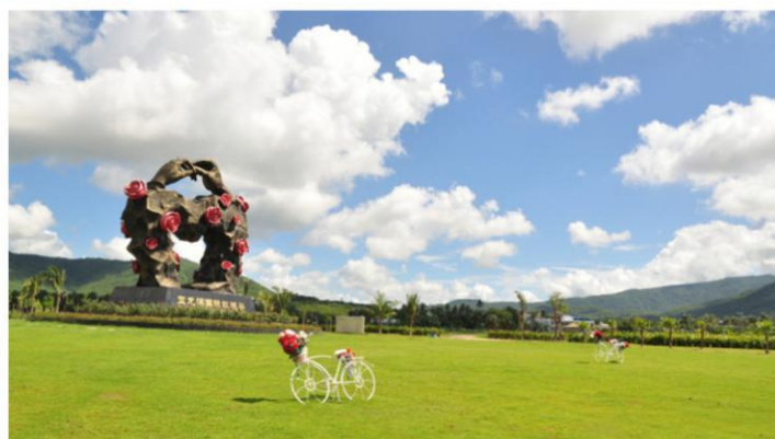
亚龙湾热带天堂森林公园4A 穿越雨林去看海