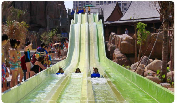
# 四彩竞速滑道 #