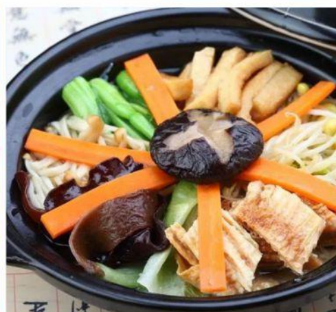
◆ 素斋 素食之精华，养生又健康