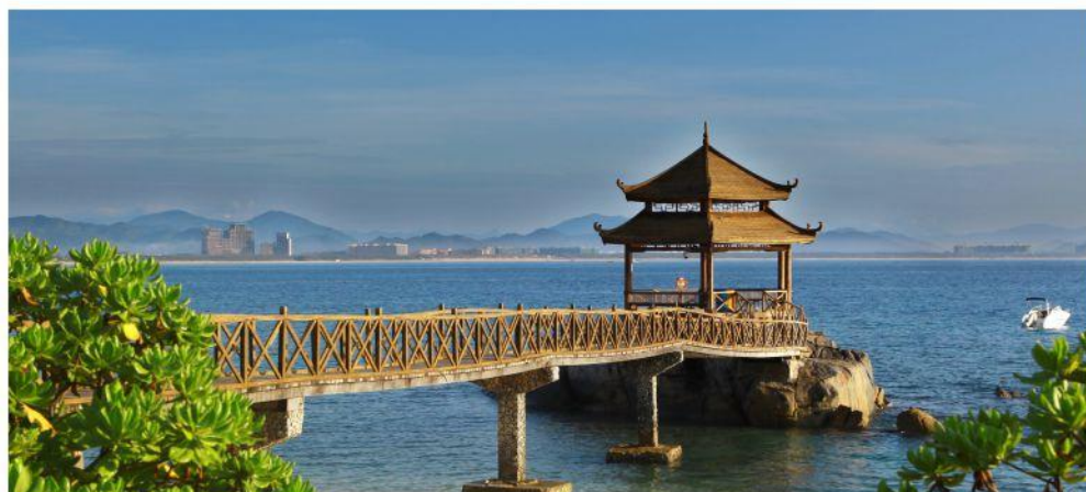
◆ 蜈支洲岛 5A 中国的马尔代夫