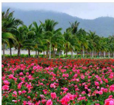
◆ 玫瑰谷 3A 亚洲规模最大玫瑰谷