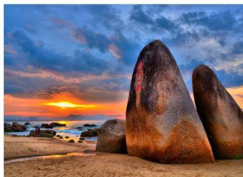
◆ 天涯海角 4A 海南名片，久负盛名