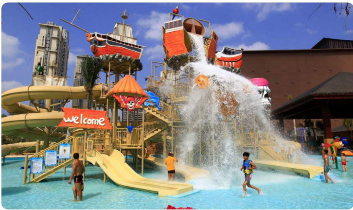
# 儿童水寨 #