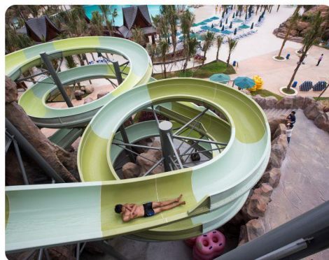
# 双螺旋组合滑道 #