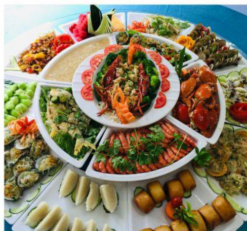
◆ 哪吒闹海海鲜餐 豪华阵容，满足味蕾，刷爆朋友圈