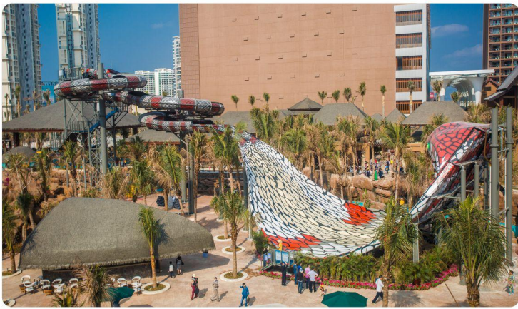
# 眼镜蛇滑道 #