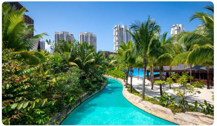
# 漂流河 #