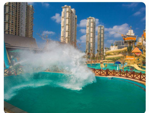
# 大水炮 #