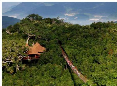
◆ 天堂森林公园 4A 影视取景拍摄地