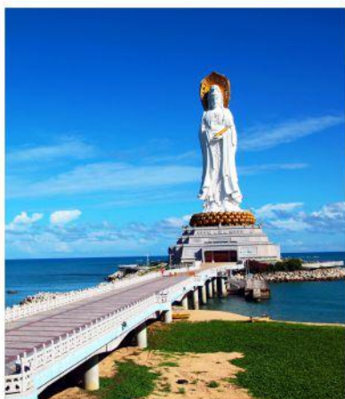
◆ 南山 5A 世界第一的南海观音圣像