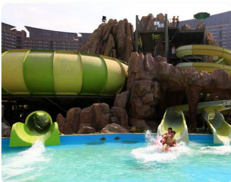
# 巨兽碗滑道 #